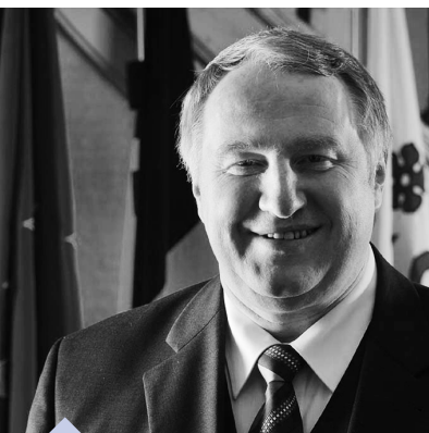
Mitglied des Bürgerkomitees Ministerpräsidenten Karl-Heinz Lambertz

Seit 1978 Mitglied der Landesregierung und seit 1989 Landeshauptmann Südtirols und Mitglied der Südtiroler Volkspartei.