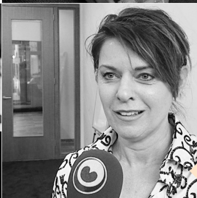
Mitglied des Bürgerkomitees Vorsitzender Dr. Valentin Inzko

Regierungschef der Deutschsprachigen Gemeinschaft in Belgien und Fraktionssprecher der Sozialdemokratischen Gruppe im Ausschuss der Regionen.